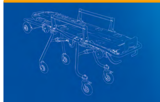
TABELLA COMPARATIVA BARELLE AUTOCARICANTI